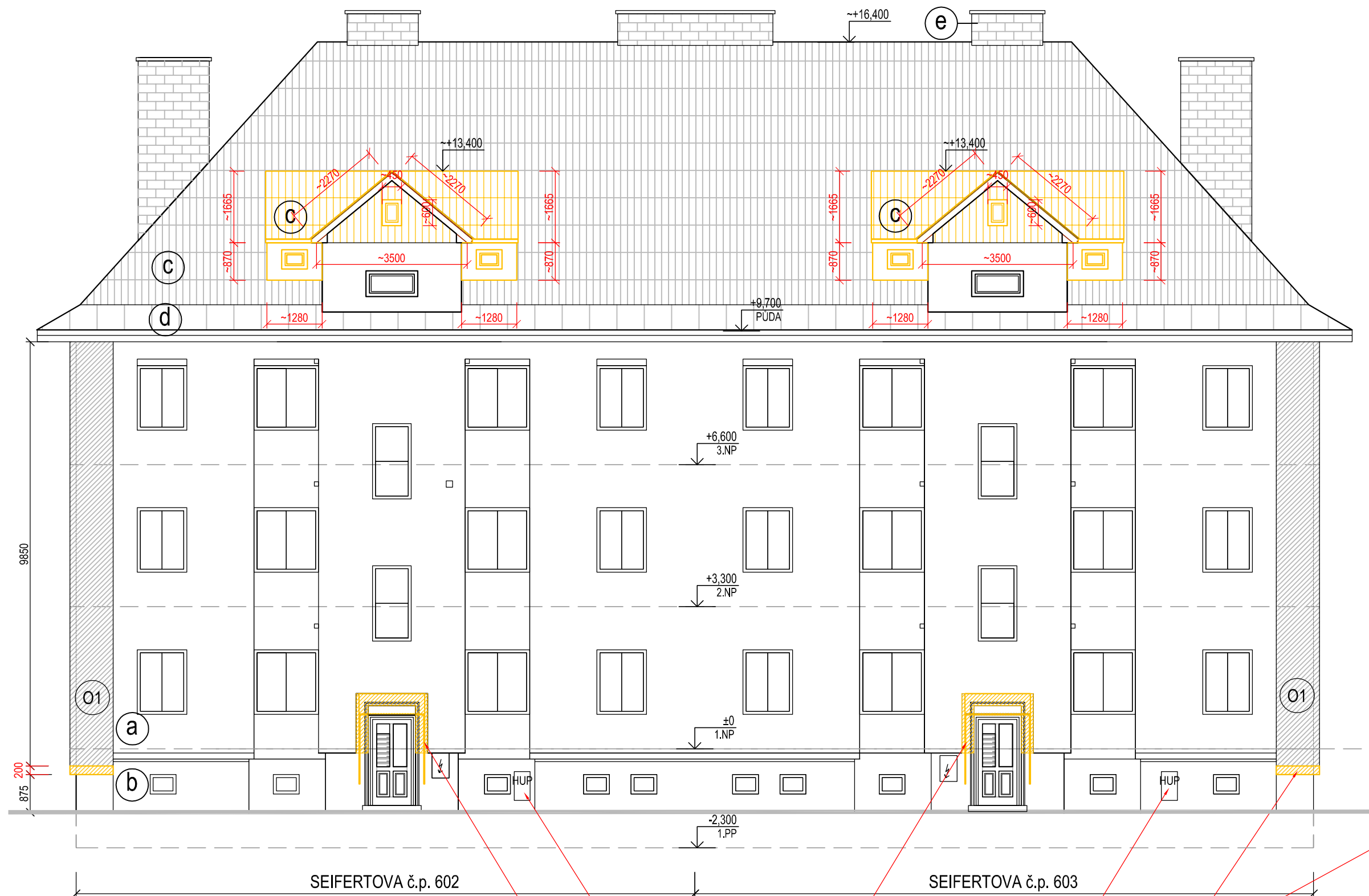
POHLED OD JIHOVÝCHODU - stávající stav