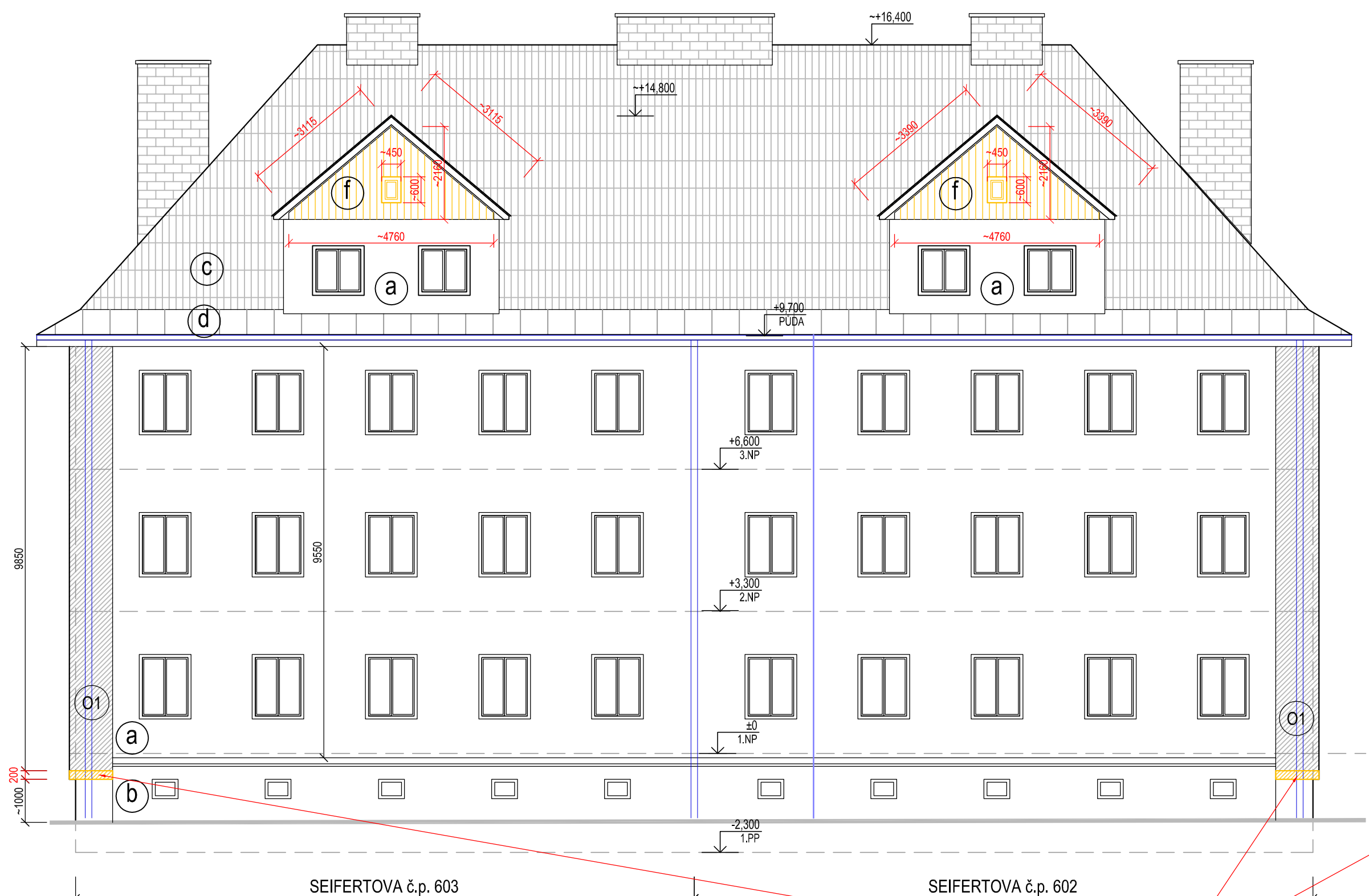
POHLED OD SEVEROZÁPADU - stávající stav